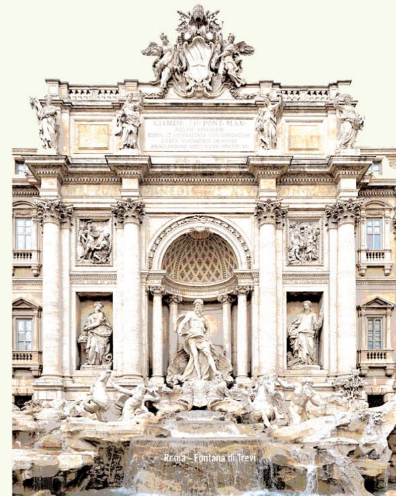
Roma - Fontana di Trevi